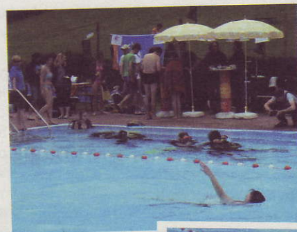
Viel los am und im Becken