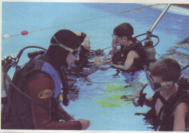
Letzte Einweisungen vor dem Abtauchen