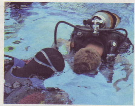
Immer schön durch den Mund ein- und ausatmen