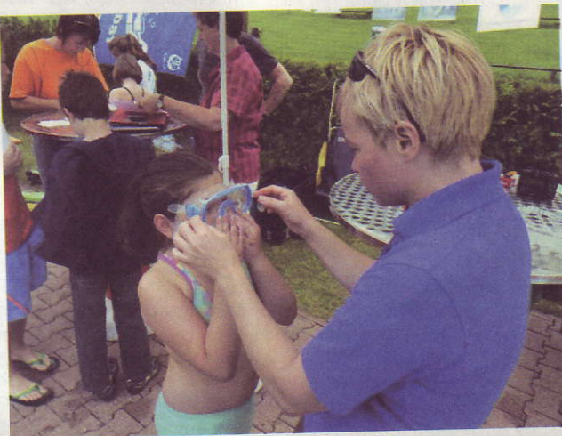
Passt die Brille?